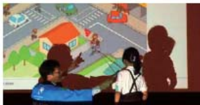
「正しい走り方」独自のアイデアや工夫で、子どもたちは楽しみながら学ぶ（忠岡町「放課後子ども教室」にて）。