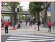
自転車を自転車通行空間に誘導

平成28年11月、御堂筋の緩速車線のモデル整備として、千日前通以南の区間で歩道を拡張、自転車通行空間が確保され供用開始されました。オープニングセレモニーでは「世界に誇る安全・安心で快適なメインストリート宣言」を協議会会長が読み上げ、その後、近隣の町会、商店会、沿道企業、大阪府等が協働で自転車道走行と駐輪場利用の啓発活動を実施しました。