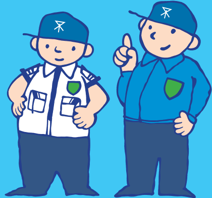
路上喫煙防止指導員が巡回しています。

路上喫煙とは、歩行中、立ち止まった状態、携帯灰皿の使用、自転車、自動二輪車などに乗車中も含めた、道路等での喫煙です。