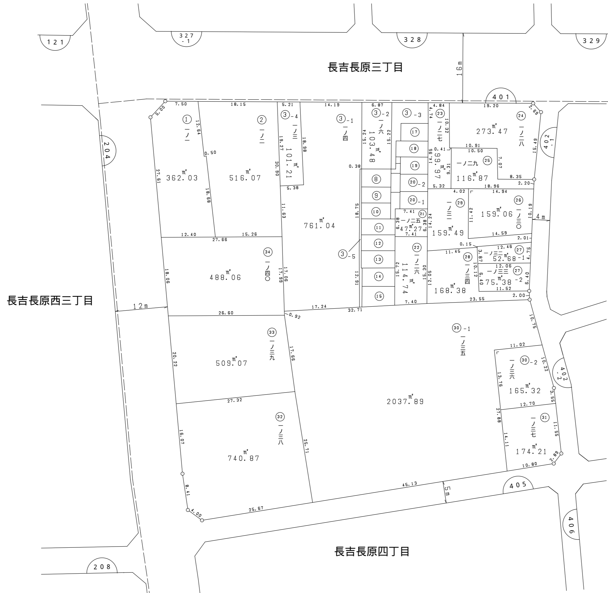
拡大図 縮尺 1 : 200