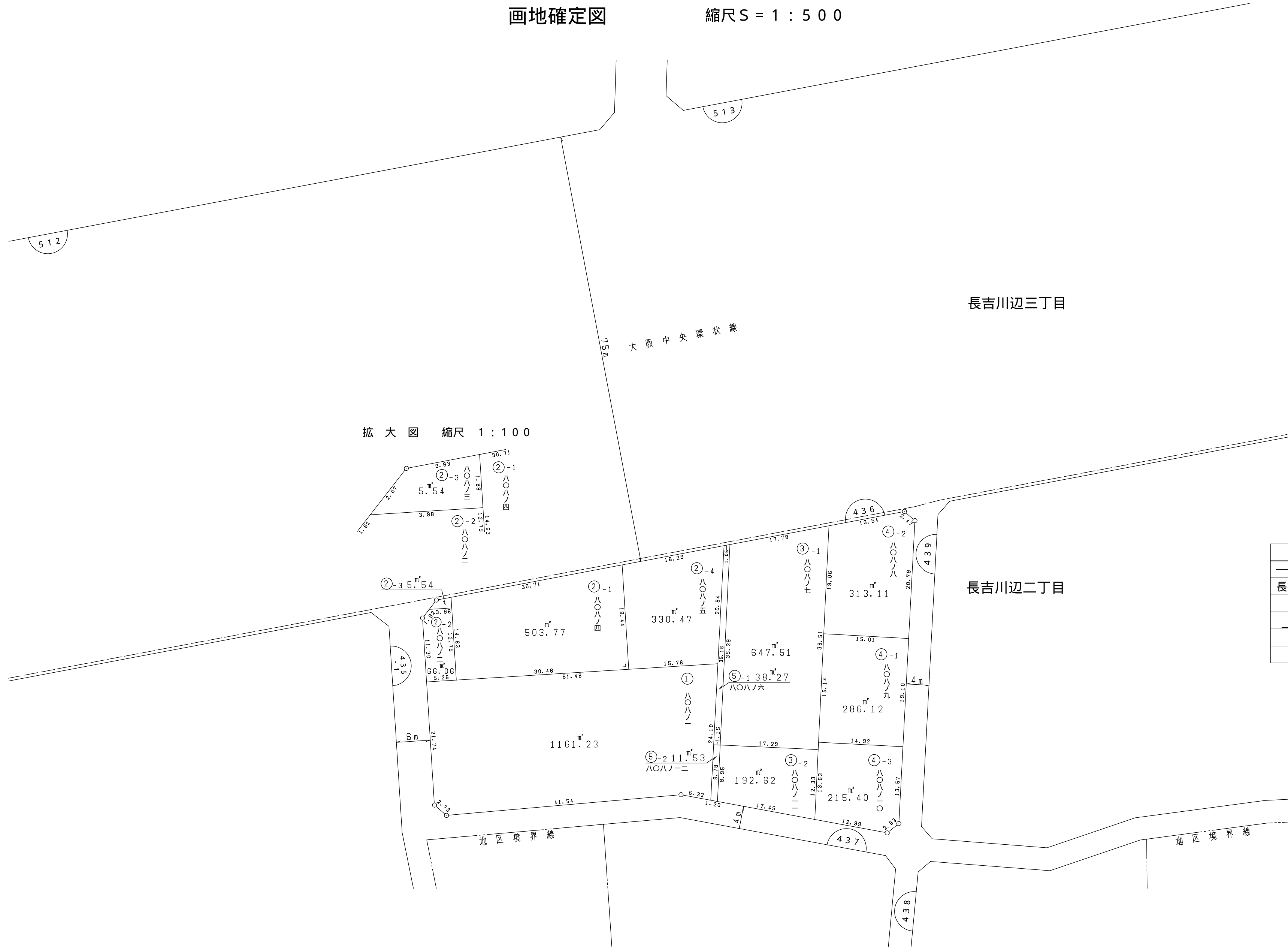
拡大図 縮尺 1 : 100