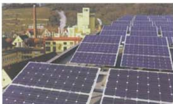
環境政策都市(ドイツ フライブルグ)