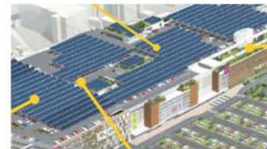
ソーラーパネルの設置や予熱利用による空調 (出典:国土交通省平成20年度第1回住宅・建築物省CO2推進 モデル事業採択プロジェクト URL: http://www.kenken.go.jp/shuoco2/pdf/presentation1.pdf )