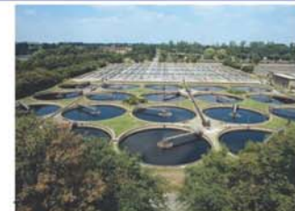
環境調和型の下水処理場(イギリス ロンドン)