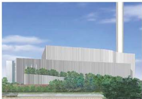
緑化による周辺地域への配慮と調和 (大阪市環境局 東淀工場)