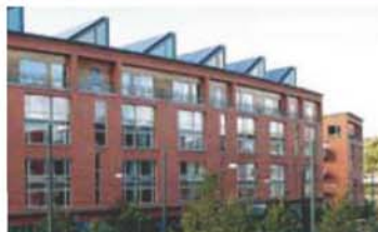
エコタウン(スウェーデン スtockホルム)