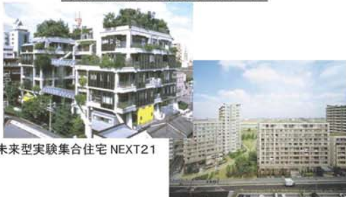
未来型実験集合住宅 NEXT21