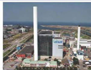
環境調和型のごみ焼却工場(スウェーデン マルメ)