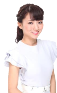
司会・進行 タレント 石塚 理奈