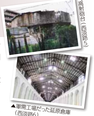
▲軍需工場だった延原倉庫(西淀路6)

戦後70年という節目の年に、皆さんも、あらためて歴史をふり振り返り、平和の大切さを心に刻んでください。