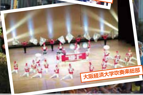
大阪経済大学吹奏楽総部