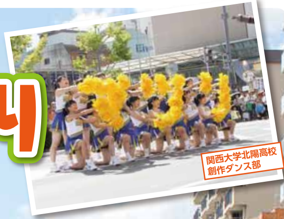
関西大学北陽高校創作ダンス部