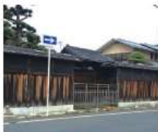
n 増池家 江戸時代後期築