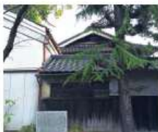
k 後藤家 明治時代築