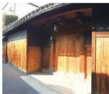
j 辻江(昌)家 明治時代築