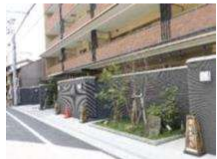
建物本体と異なる色の塀や植栽を道路に近い部分に設ける(京都市下京区修徳地区)