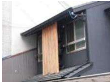
室外機を外壁色に着色し、木製格子で隠す (京都市下京区修徳地区)