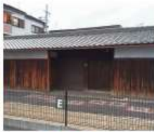
g 浅井家 江戸時代後期築