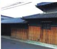
r 木村家 明治二十二年(1889)以前築