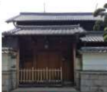
o 辻江(正)家 文化八年(1811)築