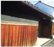
f 服部家 文政五年(1823)築