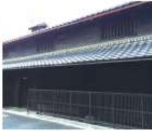
c 中谷(和)家 明治二十年(1887)築