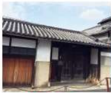
e 佐々木(高)家 安永七年(1776)築