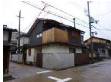
ベランダ壁の木板張りがアクセント になっている住宅(京都市伏見区)