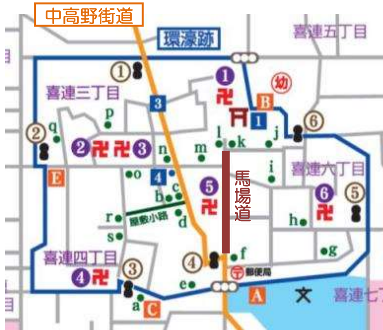
※3：「喜連環濠地区」の出入口に祀られている6つの地蔵

「喜連環濠地区」とは、概ね環濠跡すなわち環濠で囲まれていた地区(旧喜連村)をさしています。