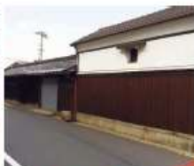
m 宮川家 江戸時代天保期築