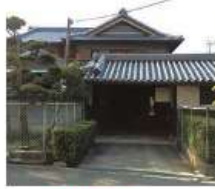
a 長橋家 江戸時代中期築

※1：100年以上前に建てられた農家造りの屋敷や蔵、塀、門などの建築物 19家によって、修繕や改修をしながら、今日なお継承されています。