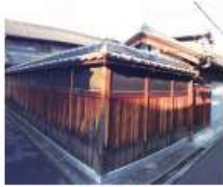
b 中谷(政)家 明治時代築