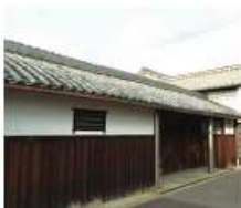
i 佐々木(昌)家 江戸時代天保期築