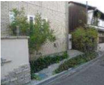
水辺を連想させる石・石板と植栽による外構デザイン(奈良県橿原市)