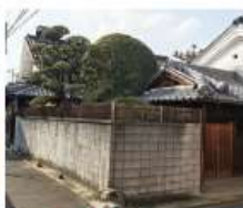
s 小林家 大正元年(1912)築

※2：人々の暮らしと地区の発展・移り変わりを見守ってきた社寺 古代から近世までに7社寺が建立され、今なお、伝統行事、学びと癒しの集いなど多様な場の中核となっています。