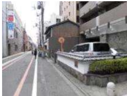
背が低い瓦塀で通りの風景に連続性を生み出す(京都市中京区姉小路地区)