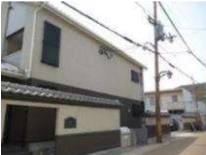
外壁の色を上下階で塗り分け、下屋や塀を設ける(枚方市)