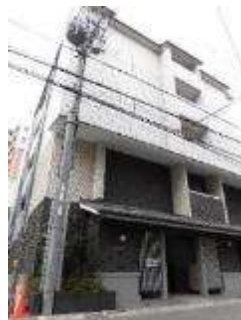
(京都市下京区修徳地区)