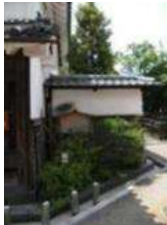
角地を活用した植栽(奈良県橿原市今井町)