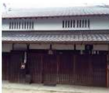
l 森本家 江戸時代天保期築