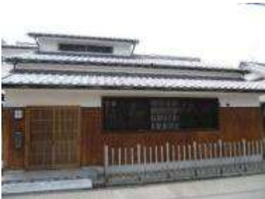
歴史ある建物の外観・色づかい・素材感を継承 (奈良県橿原市)