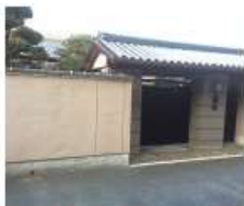
h 杉本家 天保七年(1836)築