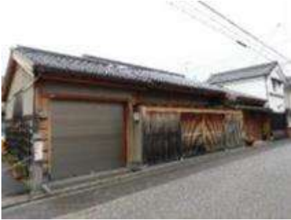
シャッターなど出入口のデザインや色づかいなどに配慮(京都市伏見区)