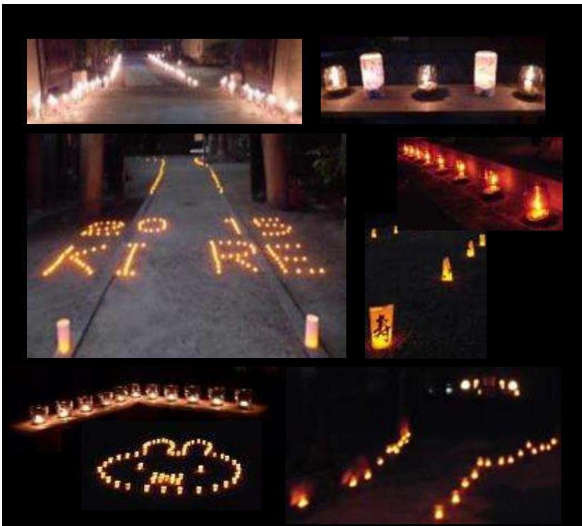
第1回喜連環灯火の夕べの様子(平成27年8月15日1社5寺にて実施)