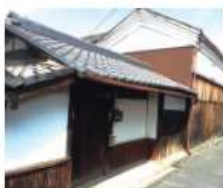
q 奥野家 江戸時代後期築