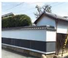
p 辻江(元)家 江戸時代後期築