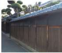
d 中谷(慶)家 嘉永五年(1852)築