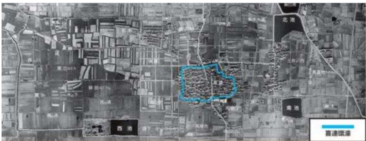
昭和17年（1942）航空写真

戦後、喜連は周辺に地下鉄や大規模商業施設ができ、環濠も下水道整備され、生活しやすいまちになりました。