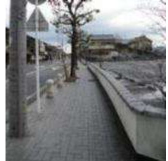
(滋賀県近江八幡市)