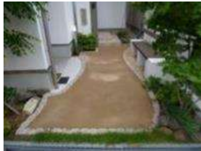
(鶴見区茨田北地域)