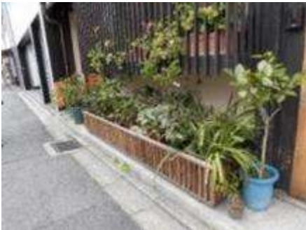
植木鉢を格子状の枠で囲い整理(京都市中京区姉小路地区)