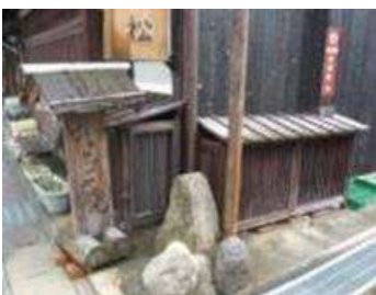
室外機を木製格子で隠す (滋賀県近江八幡市)