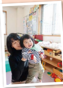
こうちゃん(1歳2ヶ月)

お友達がここの保育園の園児さんで、もこぴよのことを教えてくれました。おまごとも色々あるし、安全に遊ばせられるので気に入っています。