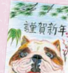
野口 正也 (中浜在住)