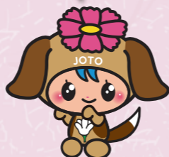
城東区マスコットキャラクター「コスモちゃん」 成年バージョン

全部で105作品の応募をいただきました！ たくさんのご応募ありがとうございます！ 全ての応募作品を1月11日(木)まで 区役所1階区民ギャラリーに展示するので、 ぜひ見に来てね！