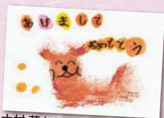
木村 菜々 (鳴野東在住)