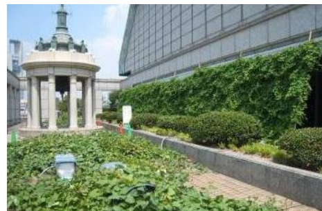
■市役所屋上での緑のカーテン・カーペット

このビジョンに基づき、平成21年度（2009年度）から、「風の道」モデル事業（長堀通における道路散水、緑化、遮熱性舗装）や緑のカーテン・カーペットづくり（ゴーヤやサツマイモによる屋上・壁面緑化）、平成22年度（2010年度）からは、ミスト装置を新たに設置する市民・事業者の方々に対し設置費用の一部を補助する「大阪市ドライ型ミスト装置設置補助制度」を実施してきたところです。