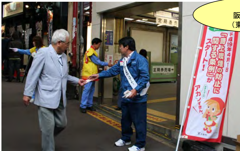
5月2日 阪急淡路駅前 (東北センター)

☆環境事業センター(11センター) による街頭での普及啓発 ・ 延べ3,053回