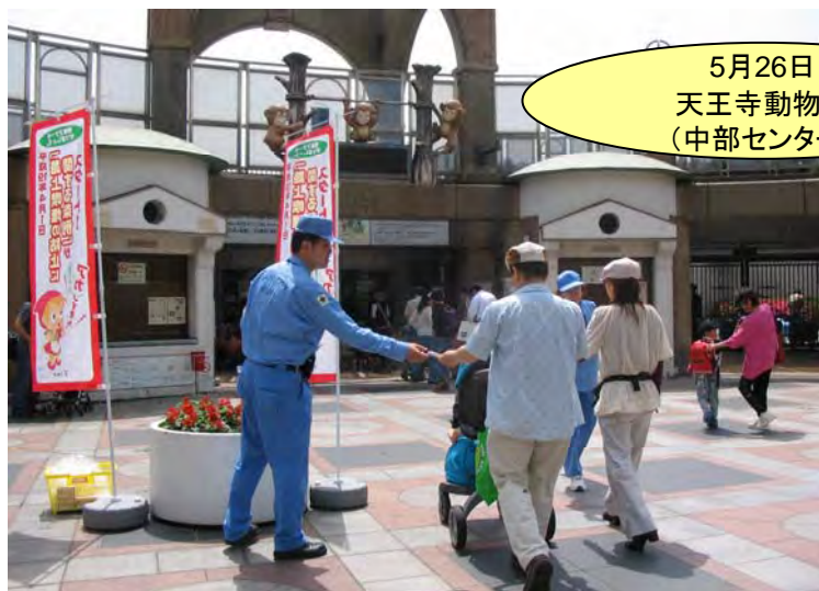
5月26日 天王寺動物園 (中部センター)