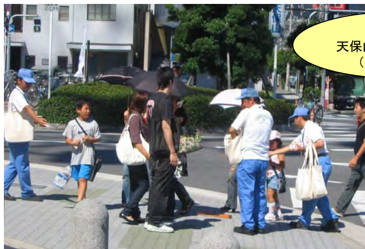
8月10日 天保山マーケットプレース (西部センター)