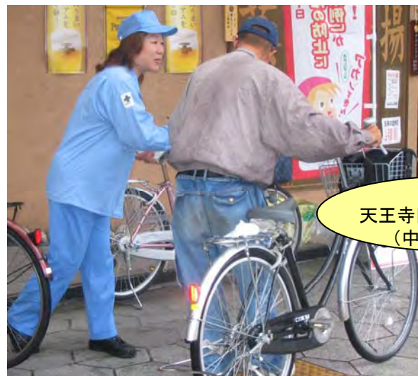
5月25日 天王寺区日出通商店街 (中部センター)