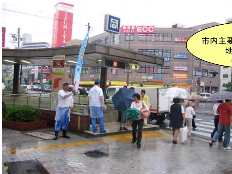
7月4日 市内主要拠点街頭キャンペーン 地下鉄あびこ駅前 (西南センター)