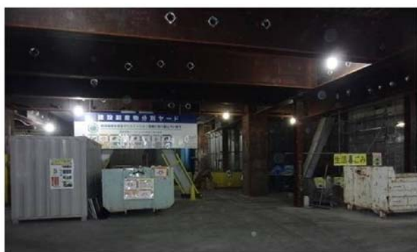
写真⑤ 廃棄物分別状況