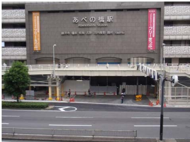
写真① 北側出入口の状況