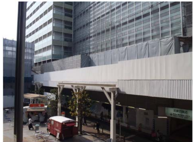
写真② 騒音対策状況