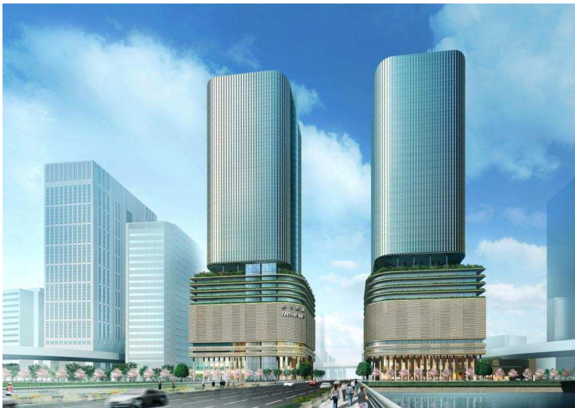
完成予想図（北側より）