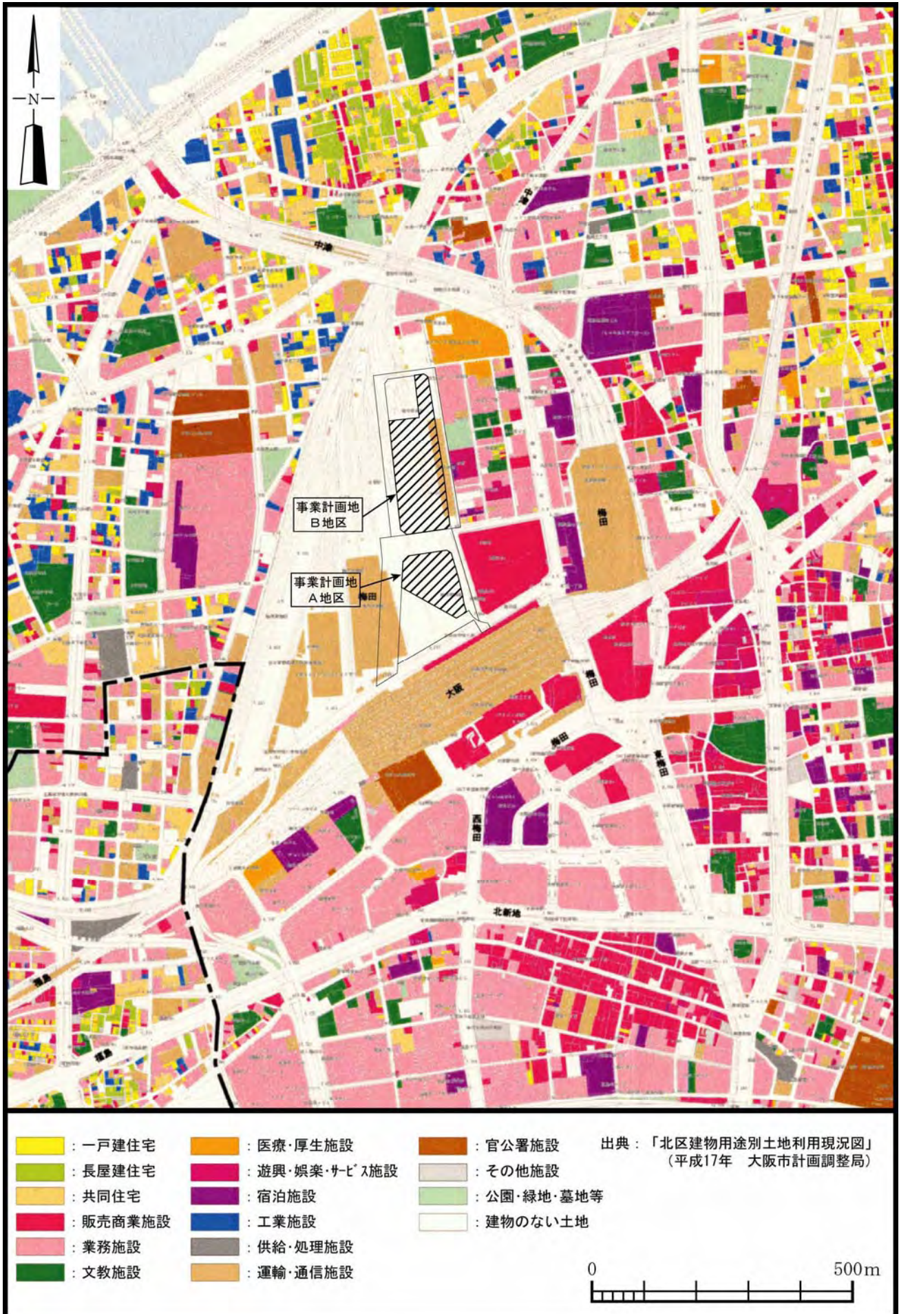
図 2-1-5 事業計画地周辺の土地利用状況