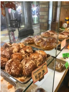
「FRESH BAKERY 太陽堂」