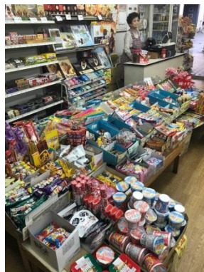
「おやつ集い マスダ」