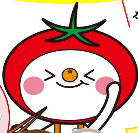
大阪市食育推進キャラクター 「たべやん」