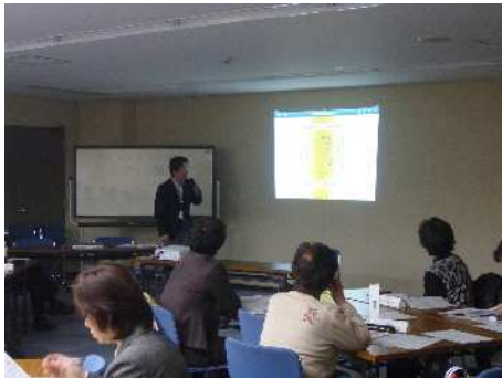
協働事業提案風景

平成 26 年 3 月 27 日(木) 大阪市役所内会議室において、 「第 10 回すこやかパートナー意見交換会」を実施しました。 当日は、すこやかパートナー24 団体と 1 区役所の参加がありました。 事前に申請のあった「すこやかパートナー5 団体」からの協働事業の 提案をいただいた後、当日参加団体による意見交換を行っていただき、 短時間ながら活発な意見交換が行われました。