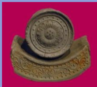
難波宮跡で出土した軒瓦 (大阪歴史博物館蔵)