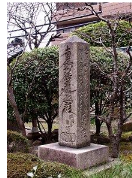
23 西行と遊女妙の歌碑 (江口君堂)