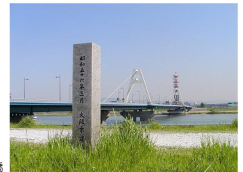
28 平田の渡し跡と豊里大橋