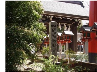
7 上田秋成寓居跡 加島鑄銭所跡