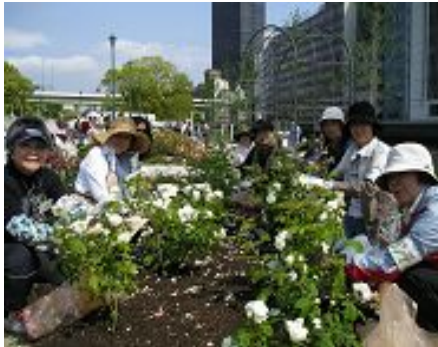
ボランティアの皆さん、楽しく花がら摘み

秋バラの開花期には、ボランティアの皆さんが中心となって、バラ園内の見どころ案内や緑化相談会の開催も予定しています。