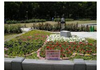
きれいに仕上がりました

園長先生は「土に触れ合う機会を与えてもらい、子どもたちがますます靱公園に愛着を持ってくれると思います」と喜んでおられました。