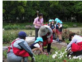
順番に教えてもらい植え付け

「靱公園は私たちの庭」と、日頃から園児たちや保護者の皆さんに親しまれている同公園内で、今回は、園児がデザインした「幸せを呼ぶ四つ葉のクローバー花壇」に、色とりどりのペチュニアを植え付けました。