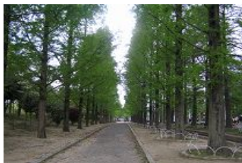
鶴見緑地のメタセコイアの並木道

生命の息吹を感じ、季節ごとに咲き競う花の美しさとは違った風情を味わうことができます。みどりのオアシスに一步足を踏み入れてはいかがですか。