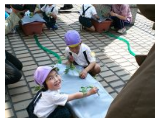
水の入ったプランターを覆うシートに穴を差し込みます。「おじちゃん、これでいいの?」