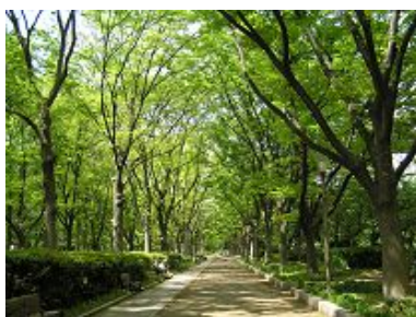
鞆公園のケヤキの並木道