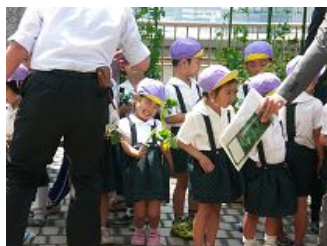
苗をもらって思わず“にっこり”

最初は、神妙な顔つきだった園児たちも、サツマイモの苗を手にとり、いよいよ作業に取りかかる頃には笑顔があふ