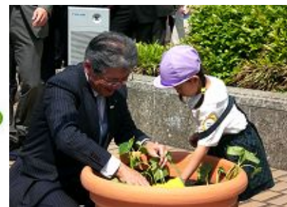
平松市長といっしょに植えました