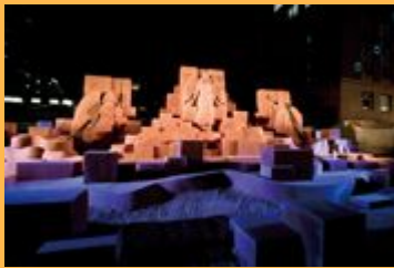
砂像 都会に舞い降りた天使の物語Ⅱ (西会場)