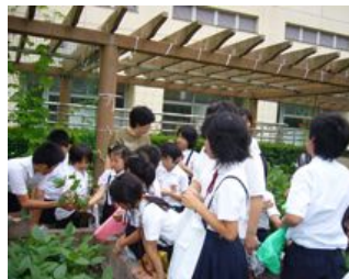
屋上緑化に取り組む児童たち

ド対策の一つとして、屋上緑化を進めています。開平小学校では、平成18年より、サツマイモ・落花生の栽培に取り組み、見事な緑のカーペットをつくることで