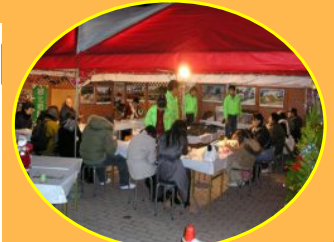
緑のワークショップ (東会場)

平成21年12月1日から25日までの間、中之島地区で、水都大阪の冬の名物詩「OSAKA 光のルネサンス」を開催します。今年は「中央会場」、「西会場」、「東会場」の3ヶ所を中心に、楽しく魅力的な光のイベントをご用意しています。