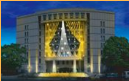
スターライト・シティ・スクエア