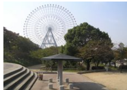
山頂付近より撮影。公園整備時の盛り土によって、「山頂」より高いところもあります。

江戸時代の大阪の名所、天保山に造られた公園で昭和33年に開園しました。天保山は、天保2年(1831年)に安治川・木津川口の大川 さくら 浚えで生じた砂を積み上げてできた人工の山で、当時、この付近一帯にサクウラが植えられ、行楽地としてにぎわっていました。