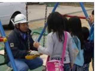
おっちゃんの話聞いてくれる?

11月3日、大宮西小学校(旭区)で、「大宮西小学校区教育協議会が主催する「中宮地域ふれあいデー」の取り組みとして「公園遊具の正しい使い方教室」が開催され、120名に及ぶ子どもたちと保護者の皆さんが参加されました。