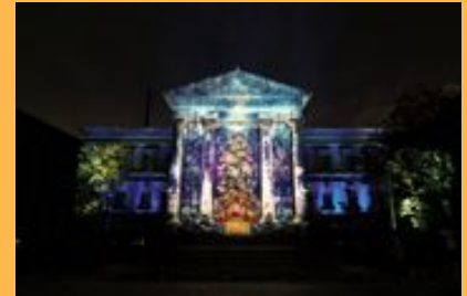
ウォールタペストリー (いずれも中央会場)