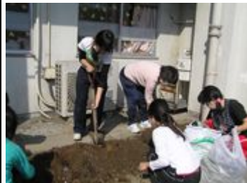
土を掘りおこし、根っこや雑草、ガラをていねいに取り除きます。

10月29日、高松保育所(阿倍野区)で、ソウ糞堆肥を入れた土づくりが行われました。