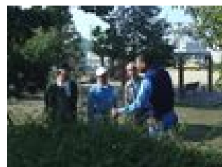
講習会のようなす(平尾亥開公園)

参加された皆さんからは、「今まで知らなかったことも多く学べて、これからの活動に大変参考になりました。」と、喜んでいただきました。