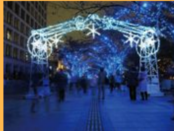
中之島イルミネーションストリート