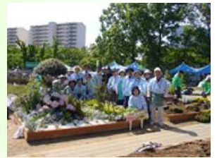
優秀賞をいただきました。テーマは「ゆめのはなその」

区役所や公園事務所と連携しながら、これまで区役所前の花飾りや区民まつりへの参加、「はならんまん」での市民花壇コンクールへの出展をはじめ、「心に花咲く中央区」を合言葉に地域での緑化活動に取り組んできました。今年の「はならんまん2009」の市民花壇コンクールでは、優秀賞をいただき、「来年は最優秀賞を！」とメンバー全員はりきっています。それでは、いくつかの取り組みを紹介します。