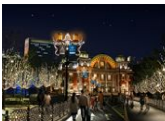
フランス・デルミエールの取り組みのひとつである、白と金の光輝くエールフランスアベニュー

平成21年12月1日から25日までの間、中之島地区で、水都大阪の冬の名物詩「OSAKA 光のルネサンス」を開催します。今年は「中央会場」、「西会場」、「東会場」の3ヶ所を中心に、楽しく魅力的な光のイベントをご用意しています。