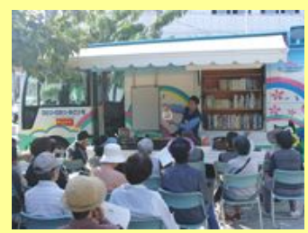
10/15 神路公園(東成区)での緑化講習会

今月は、大阪城公園で 12月8日(火) 13:15～16:00 「松竹梅の作り方」を開催します。 (参加自由・無料、雨天決行)