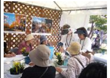
区民まつりでの講習会のようす