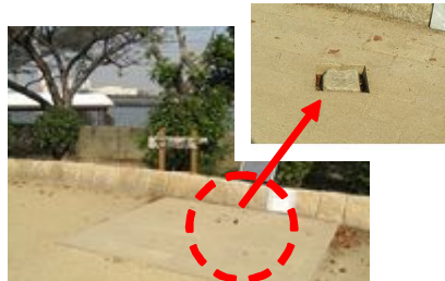
山頂を示す二等三角点の標石

現在、周辺には海遊館、大観覧車、ショッピングモールなどがあり、レジャーの拠点になっています。地元の皆さんだけでなく観光客の散策の場として広く親しまれています。