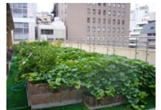
校舎屋上に広がる緑のカーペット