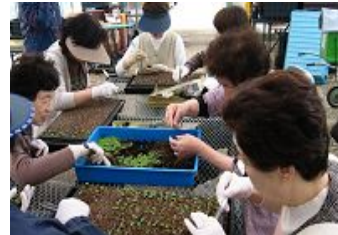
阿倍野区花づくりときわ