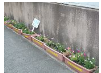
最終配置場所(長池連合会館前)