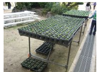
第2次育成場所(阿倍野小学校)