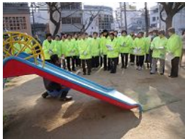
熱心に聞き入る「おくらと守る会」の皆さん。

1月15日、日本橋公園(浪速区)で、「おくらと守る会」の会員の皆さんの参加で、公園の清掃活動終了後に、花とみどりの相談車「ひとりふみ号」を使い、「地域に根ざした安全な公園づくり」の講習会を開催しました。当日は、公園に設置されている遊具を利用し、遊具の安全な使い方と遊具を使用する前の安全確認のポイントを中心に講習を行い、参加された皆さんから「今後も公園を見守っていく一員として、安心・安全で快適な公園をめざしたい」と力強い感想もいただきました。