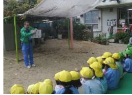
わかったかな?ハーイ

磯路保育所(港区)では、ソウ糞堆肥を使った「リサイクルの輪」の取り組みを行っています。10月にソウ糞堆肥を使って土づくりを行い、翌月にグリーンコーディネーターの皆さんの協力の下、園児たちがオタフクマメやミニキャロットの種を撒きました。また、12月17日には、順調に育った苗の観察を行った後、園児たちと保育士さんたちの参加で、公園の安全利用の講習会を開催しました。園児たちにわかりやすいイラストを用い、正しい遊具の使い方や、遊具を利用する際の服装などの注意点を中心に説明をしたところ、寒い中でしたが、園児たちは一生懸命聞いてくれました。