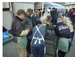
種まき作業を行う種花ボランティアの皆さん

みでまちがきれいになり、地域の皆さんのコミュニケーションづくりのきっかけになれば」と、種花運動への熱意を語っていただきました。今後、ボランティアの皆さんにより丹精込めて育てられた花が、西淀川区で暮らす人々に、安らぎや和みを与えてくれることでしょう。