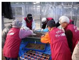
3号ポットへの移植作業を行う「さざびーグリーン倶楽部(種花ボランティアグループの愛称)」の皆さん

最初は、ピンセットを使った細かい作業に四苦八苦していたボランティアの皆さんも、時間が経つにつれ、手馴れてきて作業もスムーズに。