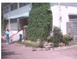
十三公園事務所の緑のカーテン