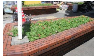
花いっぱい 完成後の花壇

しみのある花壇を作りたい」との思いや「花を植え付けたことにより、たばこのポイ捨てや不法駐輪が減