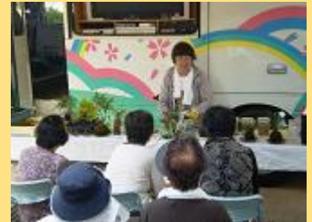
7/26 五条公園(天王寺区)での花と緑の講習会