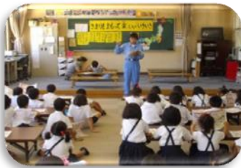
遊具の安全な使い方講習を熱心に聞き入る子どもたち