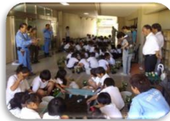
楽しく植え付けよう

この日は厳しい暑さにもかかわらず、元気いっぱいの子もたちは土の感触を楽しみながら植え付けをおこない、無事終了することができました。