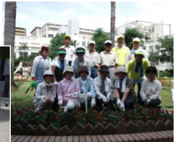
愛護会の皆さん 会長は最後列右

められている安松谷会長は「日本橋公園は、都会のど真ん中の公園で、ごみや不法投棄など、いろいろな問題が毎日ありますが、愛護会のメン