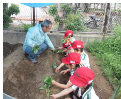
こうやって植えるんやで

南港緑公園愛護会（住之江区）は、清掃やふれあい花壇など活動を行う一方で、約10年前から南港緑小学校の「ふれあい授業」の一環として、毎年、サツマイモの苗の植え付け指導を行い、秋には、イモ掘り、焼きもづくりを小学校の児童と行っています。