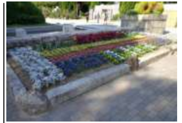
大阪城公園森ノ宮駅前花壇

し、その後、植え付けていた花苗や樹木は、大阪城公園内の花壇や花博記念公園鶴見緑地内の花壇などに植え替えし、公園を訪れた方々に楽しんでいただきました。