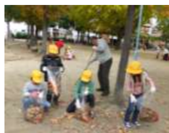
(きれいな公園にしようね)

さらに、深江地区を花いっぱいにとの思いから、36人の方が集まり今年6月に“深江花と緑部会”を発足され、「ふ