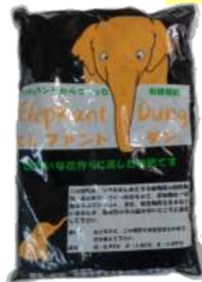
【左】『ゾウ糞有機堆肥』(平成14年から配布)