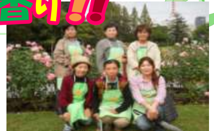
靱公園フラワーボランティアの皆さん

20日は、小雨の降るあいにくの天気でしたが、多くの方々がツアーに参加されました。