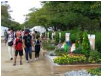
21基の市民花壇で会場を演出!

開催当日は、天候にも恵まれ、延べ38,000人の方々が来園し、各区のグリーンコーディネータや緑化リーダーの皆さんが作成した花壇が、西の丸庭園を華やかに演出し、会場の一角を