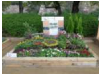
「はならんまん賞」に輝いた天王寺区作成の花壇

10月12日(土)・13日(日) 大阪城西の丸庭園で、人材育成ネットワーク事業「はならんまん2013」を、大阪ウォーク・大坂的グルメグランプリとの共催事業として開催しました。