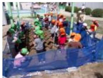
「リサイクルの輪」に取組む子どもたち