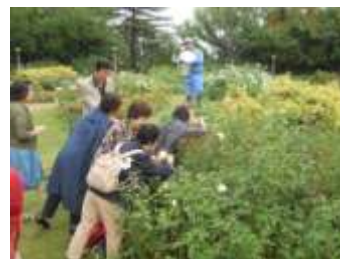
香りの違いを楽しむ

また、参加者の皆さんからは「初めて参加しましたが、香りの違いを楽しめました。また春も参加したいです」と話してくれました。