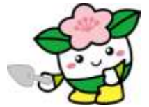
天王寺区マスコットキャラクター“もてんちゃん”↑

天王寺区では23、東成区では24、生野区には57公園に公園愛護会があります。地域の皆さんの安らげる場として気持ちよく利用していただけるように美化活動や季節に応じた草花の植え付けなど取り組まれています。個性豊かな活動をいくつか紹介します。