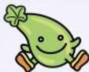
東成区マスコットキャラクター“うりちゃん”→