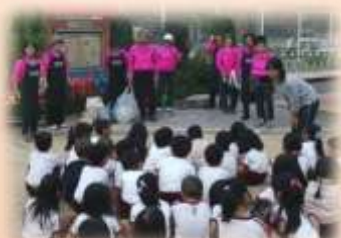
(桃園G・Fクラブの皆さん)