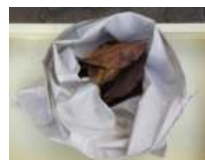
落ち葉を入れた状態

落ち葉ごみの減量化にもつながる、みどりのリサイクル活動に、ご協力をお願いします。