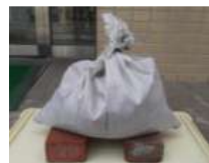
レンガを置いて通気性よく