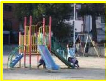
元気に遊ぶ子どもたち

天王寺区の国分公園は、奈良時代の摂津国分寺跡に出来た由緒ある公園として、近隣の方々の憩いの場として親しまれている一方、非常災害時には、一時避難場所として指定されている