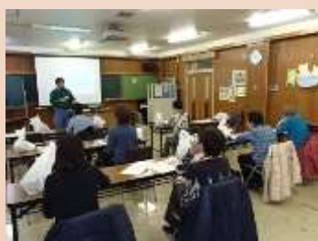
知識習得のため頑張っています

熱心に講義を受講されていた参加者からは、「これから1年間で、いろいろな事を勉強していくのが楽しみ」との声が寄せられ、区内各所で活躍いただけるように、1年かけて、花と緑の知識を習得されます。