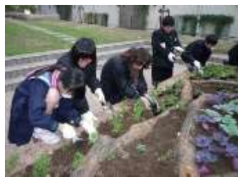
生徒さんと岡橋GC(中央)