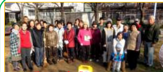
12月13日に、清掃活動に参加された皆さん

の清掃除草を中心に活動しています。子どもから大人まで、日々、安心して安らげる良い公園にしていきたい」と語られました。