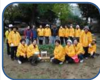
みんなで頑張っています!