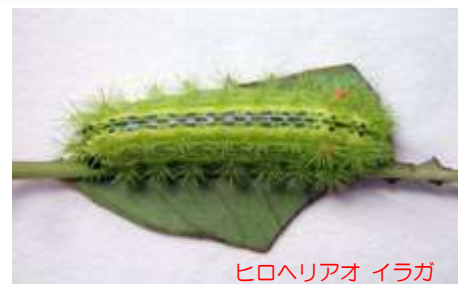
ヒロヘリアオ イラガ

病害虫のすみかになることがあります。日ごろから落ち葉清掃などを行い、清潔に管理しましょう。