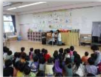
加島第一保育所(3月2日)

児たちは、緊張していたみたいですが、紙芝居をしっかりと聞くことができていました」「公園で遊ぶ時は、公園でのお約束を話してから遊んでいます。私たち以外の方から楽しくお話ししていただくことで、お約束の大切さを学べたと思います」と話していただきました。