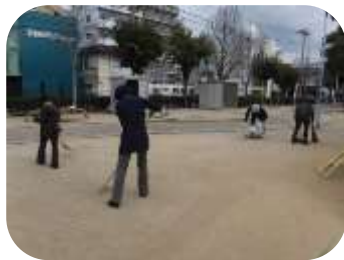
毎日清掃頑張っています

友善愛護会長は「ごみを拾ってくれている方を見かけると、公園に愛着を持ってくださると感じ、とても励みになります。今後もきれいな公園を保ち、皆さんに気持ちよく利用していただけるように頑張ります」と語られていました。