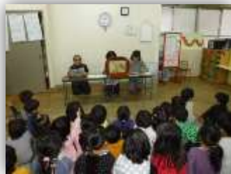
木川第一保育所(2月17日)