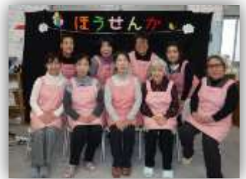
「ほうせんか」の皆さん

メンバーから「何でも言える仲間たちが、助け合いながら仲良く楽しく地域のために頑張っています」とコメントをいただきました。