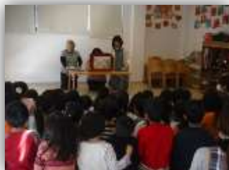
クオリスキッズ 三国本町保育園(2月27日)

せボランティア『ほうせんか』の皆さんによる紙芝居“みんなの公園”と“かみなりごろすけのしっばい”が上演され、熱心に聞き入っていた