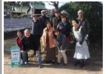
愛護会と町会の皆さん