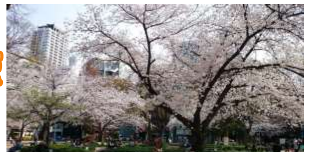
ほりえ 西区堀江公園

所在地：西区南堀江1丁目。公園面積：5,262㎡。 29本の桜が、街中でひと時の癒しを与えてくれます。