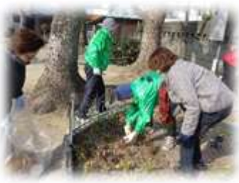
ふれあい花壇は公園のシンボル

用できるように、きれいな公園を意識した活動を心掛けています。これからも、町会の方々と協力し、楽しく愛護会活動を進めていきます」と笑顔で語られました。