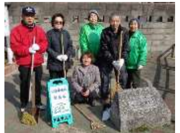
川中会長(右)と愛護会の皆さん