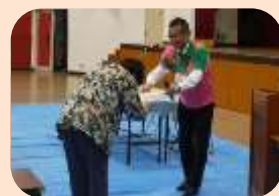
区長より修了証の授与

講習会は、2月6日の“種まきから鉢上げまで”に始まり、“土・肥料・水やりの基本”(2月13日)、“剪定・刈り込みについて”(2月27日)を受講いただいたのち、4回目となった3月6日には、グリーンクラブの皆さん(17人)に助けをもらいながら、真剣なまなざしで、寄せ植えの実習に取組まれました。