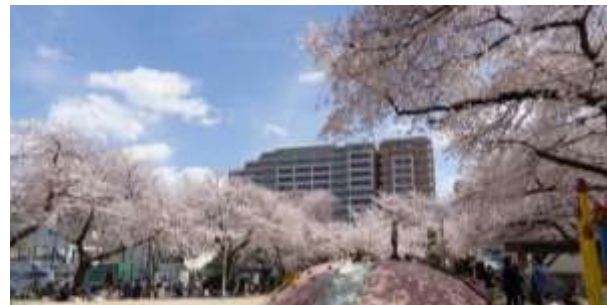
あまぎさきた 城東区鯉江北公園

春のうららかな陽ざしが降り注ぐ季節、地域の公園や街中にある桜のスポットを散策し、その場その場で違った魅力を見せる桜を觀賞しながら、心和むひと時を過ごしてみたいかがででしょうか。