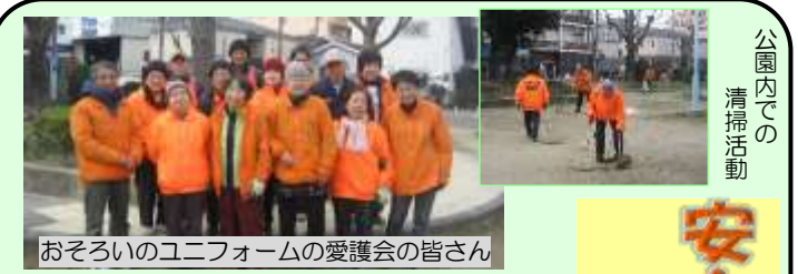
おそろいのユニフォームの愛護会の皆さん

用できるように、きれいな公園を意識した活動を心掛けています。これからも、町会の方々と協力し、楽しく愛護会活動を進めていきます」と笑顔で語られました。