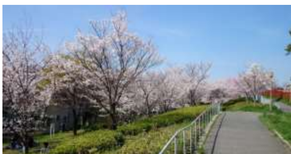
いそやま 淀川区十八条東公園

所在地：淀川区十八条1丁目。公園面積：34,802㎡。 約90本の桜が、地域に憩いの空間を提供しています。