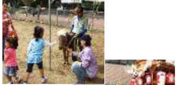
地域イベントの様子