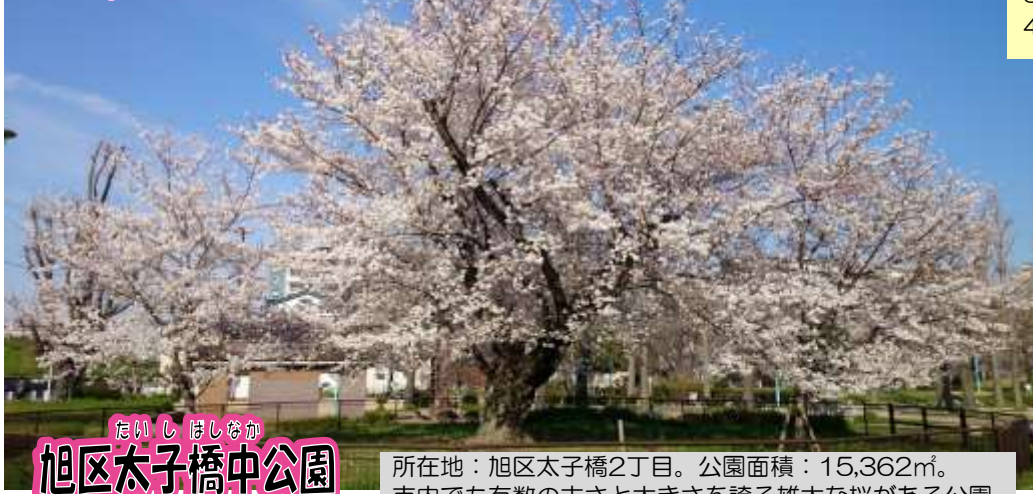
たいしほしなかに 旭区太子橋中公園

所在地：旭区太子橋2丁目。公園面積：15,362㎡。 市内でも有数の古さと大きさを誇る雄大な桜がある公園。