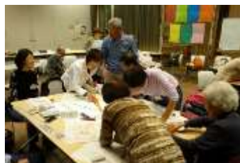
座学では仲間と意見を交わしながら

修得された22人は、少し緊張した面持ちで授与式に臨まれました。認証書を受け取り、式が終了すると、安堵した表情