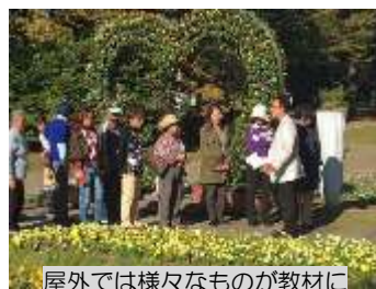
屋外では様々なものが教材に

的な担い手として、先輩GCの方々とともに、それぞれの地域を中心に活動されることとなります。