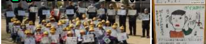
～住之江小学校4年生啓発ポスター作成～

住之江区の住之江小学校では、環境教育の一環として、4年生の児童たちが、ごみのポイ捨てなどをなくすための啓発ポスターを作成することになりました。