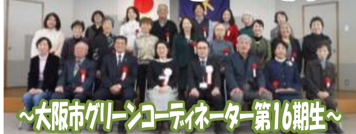
～大阪市グリーンコーディネーター第16期生～

2月28日、大阪市立早川福祉会館(東住吉区)で、大阪市グリーンコーディネーター(GC)第16期生認証授与式を行いました。