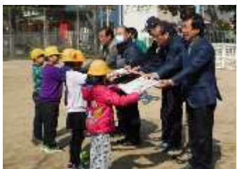
児童たちの思いとともに