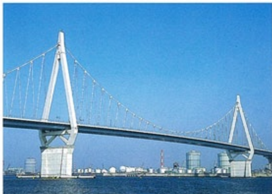
此花大橋 (平成2年) 世界的にも例のない斜めハンガーを用いたモノケーブル“自碇式”吊橋。中央支間300mの長大橋。淀川河口に位置する舞洲と、此花区桜島・島屋地区を結ぶ。