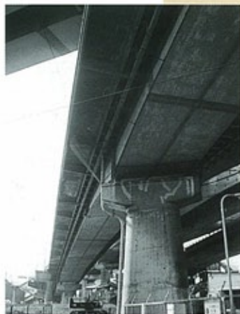
加島大橋 (昭和38年) 大阪市で最初の鋼床版桁橋。