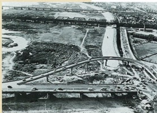
長柄バイパス (昭和39年) 長柄橋北詰の交通混雑を解消するために計画されたバイパス。 大阪市で最初の鋼床版曲線桁橋。