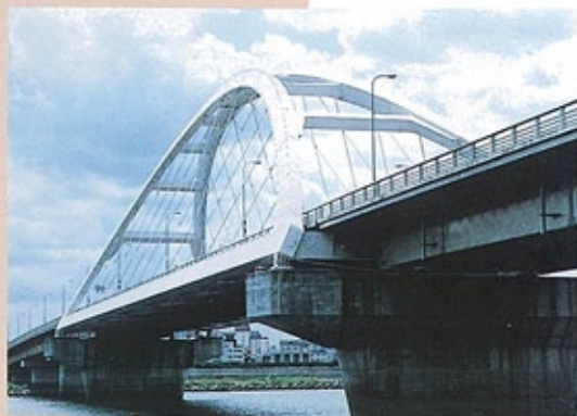
長柄橋 （昭和58年） 淀川の治水計画にあわせて架け換えられた橋。主橋梁部は支間153mの本格的ニールセン系ローゼ橋。