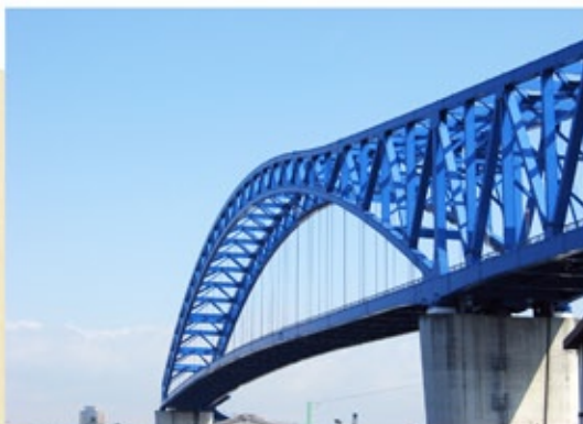
千歳橋 (平成15年) 大阪港の避難港となっている大正内港に架かる2径間連続曲線ブレーストリブアーチ橋。