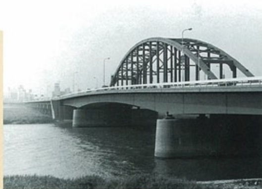
新淀川大橋 (昭和39年) 淀川を渡る最大支間115mの3径間連続鋼床版桁橋。