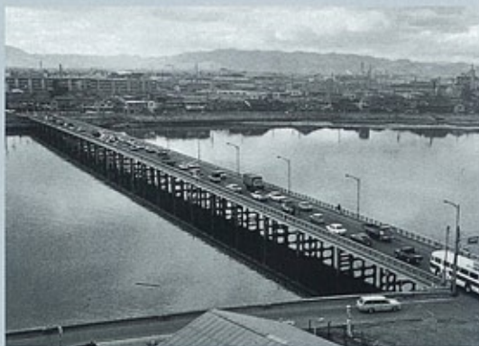
神崎橋 (昭和28年) 我が国最初の合成桁で、以後の合成桁発展への基礎となった橋。 昭和53年、現在の橋に架け換えられた。