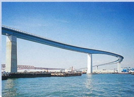
なみはや大橋 (平成7年) 尻無川河口を渡る最小曲線半径120mを有す3径間連続鋼床版曲線箱桁橋。中央支間250mは国内最大規模。大型船舶航行のため桁下高47mを確保。