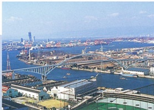
新木津川大橋 (平成6年) 木津川運河の河口部を渡るバランスドアーチ橋。中央支間305mはこの形式としては国内最大。右岸取付高架部は、17径間連続ループが採用された。