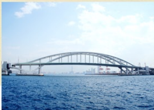
夢舞大橋 (平成13年) 大阪港の主航路が航行できなくなった場合に、大型船舶も航行できるようにした国内初の旋回式浮体橋。将来は、夢洲・舞洲の総合開発および臨海部の交通アクセスの確保に重要な役割を果たす。