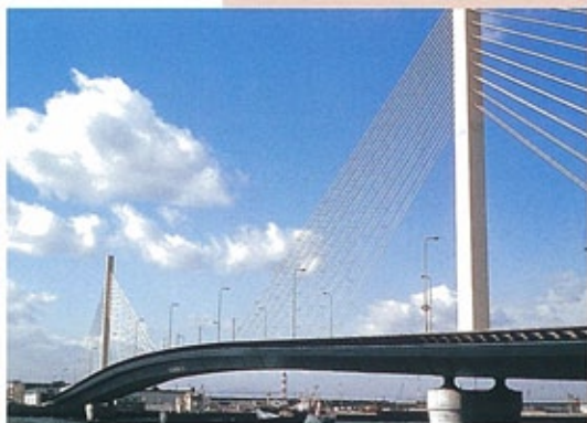
かもめ大橋 （昭和50年） 大阪南港に架かるマルチケーブルの美しい斜張橋。そのイメージが“かもめ”に似ていることから、“かもめ大橋”と名づけられた。