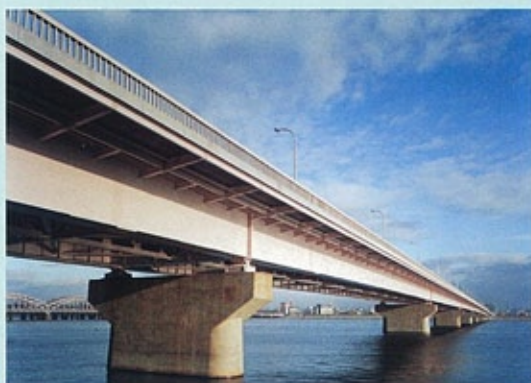
新十三大橋 （昭和41年） 2主桁構造の3径間連続鋼床版桁橋。合理的構造を追求した橋で、鋼床版の全現場滑接継手を採用。