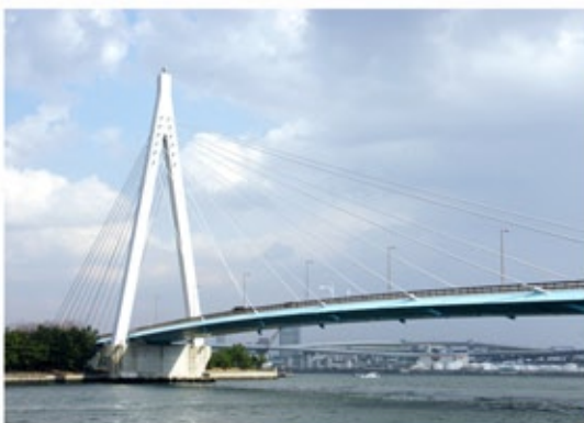
常吉大橋 (平成11年) 舞洲と此花区常吉地区を連絡する3径間連続斜張橋。最大支間250mは非対称のこの形式としては国内最大級。