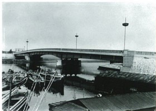
毛馬橋 (昭和35年) 我が国初の、床版にプレストレスを導入した本格的な3径間連続合成桁橋。