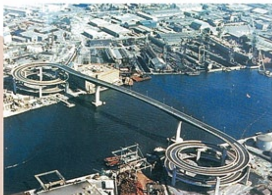
千本松大橋 （昭和48年） 船舶航行のため、桁下空間を34m確保。主橋梁部は最大支間150mの3径間連続鋼床版桁橋。取付け高架橋は12径間連続ループ。