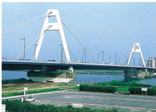
豊里大橋 （昭和45年） 長大橋化への先駆けともなった本格的斜張橋。大阪万博のモニュメントであった。