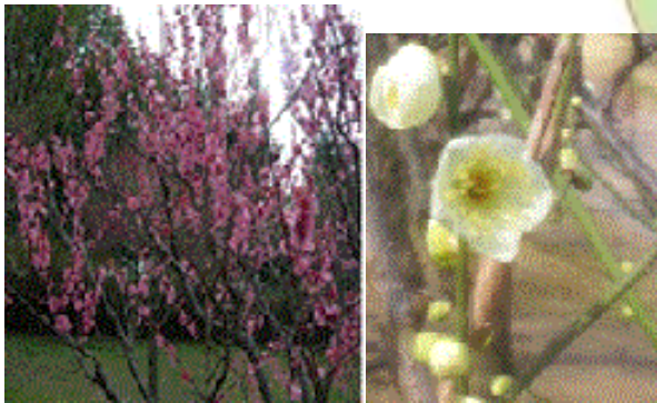
▼ウメ (ふるさとの森) 中旬頃から