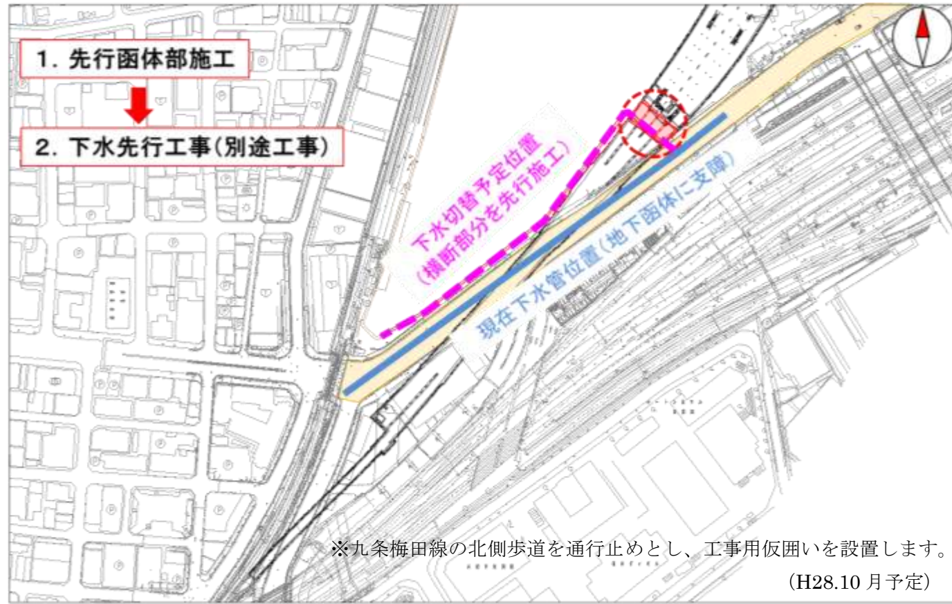
<STEP 1> 平成28年9月～平成29年4月 (予定)