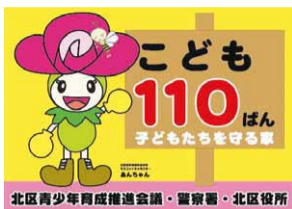
北区青少年育成推進会議・警察署・北区役所