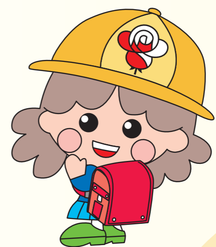
北区キャラクター のんちゃん・すーちゃん