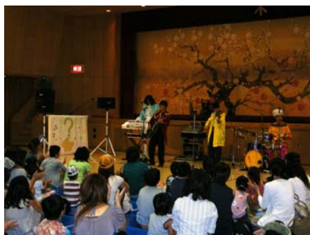
子育て支援室・民生委員児童委員連盟共催 ファミリーコンサート