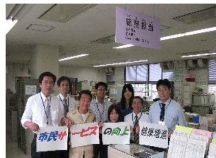
チームワークを大切にして、 しっかり仕事していきま〜す！