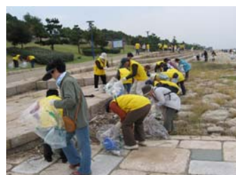
わがまちを美しく ～舞洲の一斉清掃～