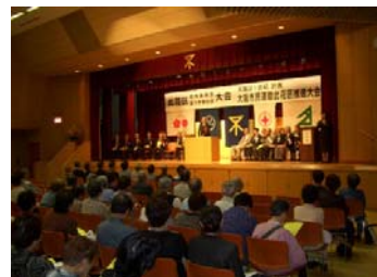
区地域振興会大会を毎年秋に開催しています