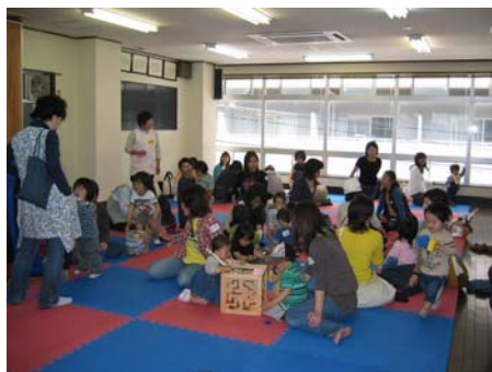
子育てを支援します ～地域の子育てサロンの風景