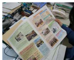
親しみやすい広報紙に していきます！