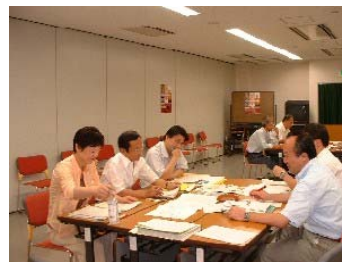
職員による職場改善の検討