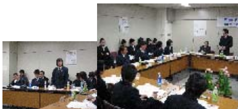
～区長と語ろう～ 区内中学生との懇談会