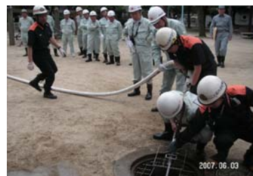
毎年、各地域で地域防災リーダーの技術研修を実施しています