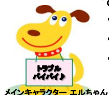
メインキャラクター エルちゃん