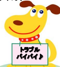
メインキャラクター エルちゃん