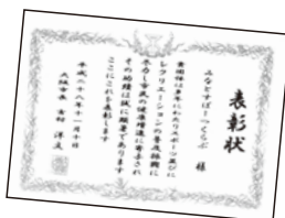
H28.11スポーツなどの 普及振興に尽力したとして 表彰されました!