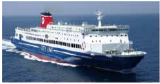
①使用予定船舶「フェリーおおさかII」

大阪港に就航する大型フェリーで、明石海峡大橋を眺めながら大阪湾をめぐるクルーズ。今年は大阪港開港150年を記念して特別に2隻で実施します。船は選べません。定員1500人(2隻計)。小学生以下は保護者同伴。日7/23(日)①11:00～14:30