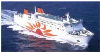
②使用予定船舶「さんぷらわあこぼると」

②11:30～15:00場集合:①大阪南港フェリーターミナル②大阪南港コスモフェリーターミナル申往復ハガキ(6/1から料金変更)で、参加人数(5人まで)・代表者(中学生以上)の住所・氏名・年齢・電話番号を書いて、〒559-0034 住之江区南港北2-1-10 ATC ITM棟10階、港湾局振興課「大阪湾クルーズ」係へ。締6/21問大阪市総合コールセンター☎4301-7285 FAX6373-3302