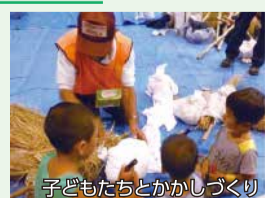
子どもたちとかがしづくり