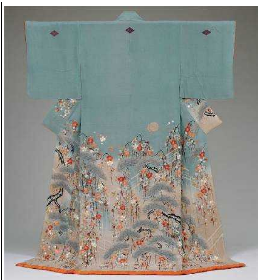
松枝垂れ桜に蹴鞠模様小袖 浅葱・薄紫 縮緬地