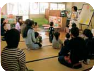
子育て支援センターの様子