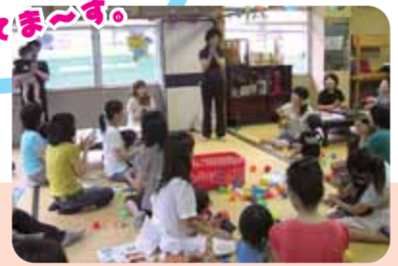
日東子育てサロン活動の様子