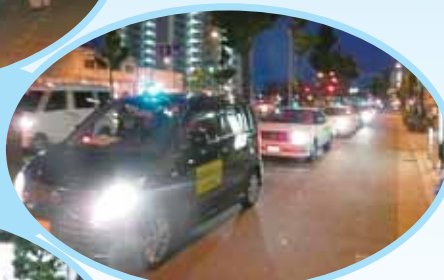
▲青色防犯パトロール活動 青パトは市内トップの保有台数 (27 台)