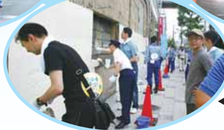
◀落書き消去活動 きれいなまちに犯罪は少ない