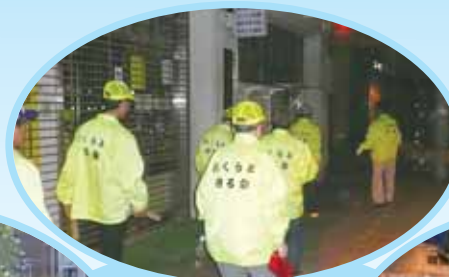
◀自主防犯パトロール 年間 180 回実施! 区内のどこかで 2 日に一度の実績