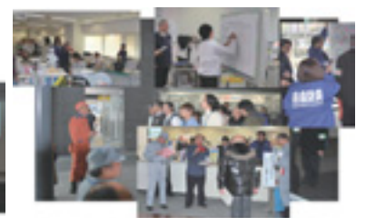
西成区役所職員防災訓練