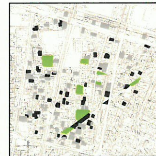
④公園・緑地・空き地・空き家・駐車場