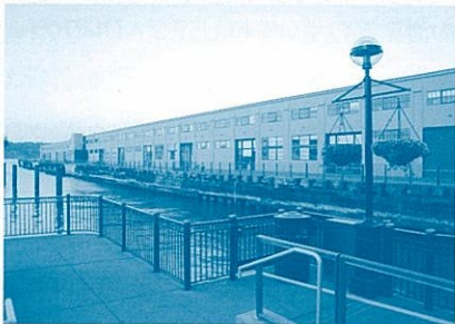
ピア1 \frac{1}{2} からピア1(SF事務所)を望む

ンフランシスコ・ウォーターフロントの開発状況を視察しました。フェリー・ビルディングを中心に、西側に広がる商業・集客エリア、東側に広がる港湾エリアあるいは大型複合再開発エリアの状況を、非常にわかりやすく把握することができました。