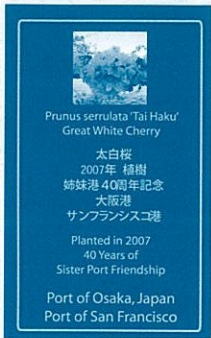
記念植樹された 桜の前に埋め込 まれるプレート