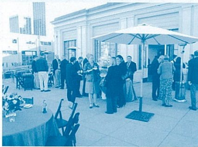
再開発されたピア1 \frac{1}{2} でのレセプション風景