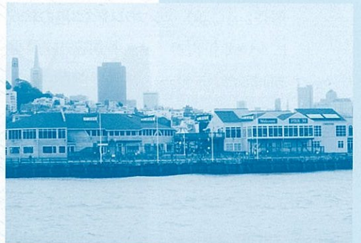
ピア39、フィッシャー・マンズ・ワーフと並んで 集客力の高いエリア