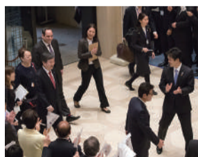
大阪市役所での歓迎の様子