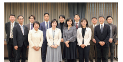
高校生意見交換会 実行委員一同