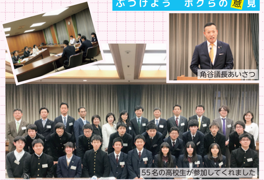
55名の高校生が参加してくれました

大阪市内在住または在学の高校生55名が参加し、30名の市会議員にさまざまな質問をぶつけました。