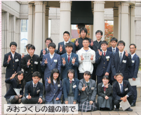
みおつくしの鐘の前で