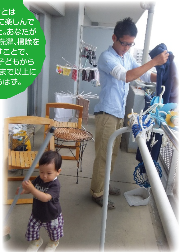
平成24年度イクメン写真コンテスト特別賞受賞作品

カジダンとは家事を積極的に楽しんで行う男性のこと。あなたが料理、洗濯、掃除をこなすことで、パートナーや子どもから感謝され、これまで以上に絆も強まるはず。