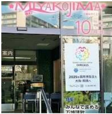
広報誌特集 「みんなで進める万博誘致」