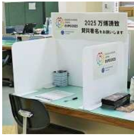
区役所庁舎での 賛同署名受付