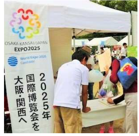
区民まつりブースで 賛同署名受付